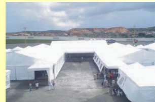
Mata de São João/BA - A tenda oferece estrutura diferenciada e confortável