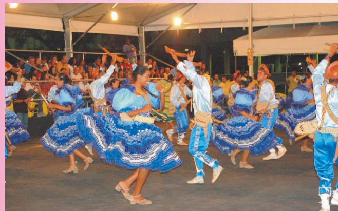
Salvador/BA - O público assistiu às belíssimas apresentações das quadrilhas