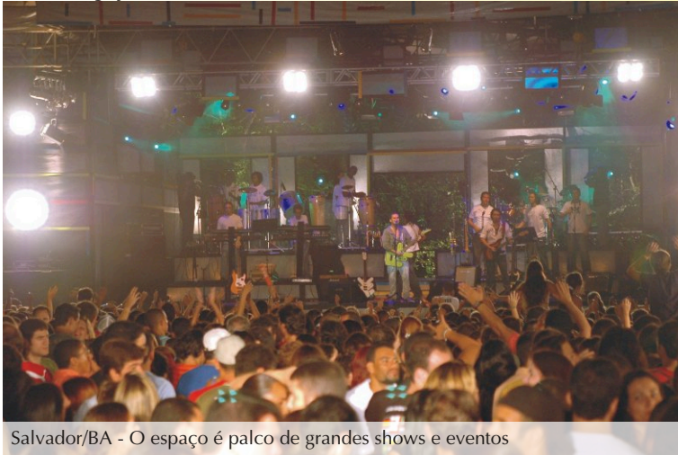
Salvador/BA - O espaço é palco de grandes shows e eventos

O ex-parque aquático Wet'n Wild hoje é sinônimo de shows, eventos e badalação. A ST Estruturas, em parceria com Marcelo Britto, da Salvador Produções e Entretenimento, fixou uma estrutura que serve a diversos estilos de eventos. Desde shows de reggae até eventos gospel, o espaço oferece estrutura e boa localização na Avenida Paralela.