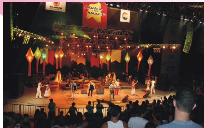
Salvador/BA - Concha Acústica lota durante o Arraiá do Galinho