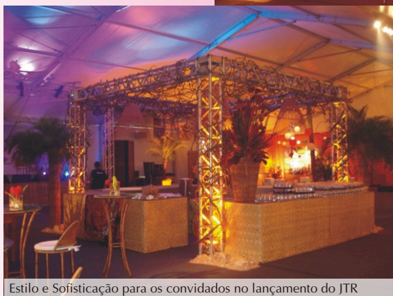
Estilo e Sofisticação para os convidados no lançamento do JTR

Maceió/AL - A ST Estruturas montou, no mês de junho, uma tenda de 800m 2 para o lançamento de vendas do empreendimento de luxo Jatiúca Trade Residence (JTR), das Construtoras Gafisa e Cipesa. A obra trabalha com o conceito de condomínio residencial e empresarial no mesmo lugar.