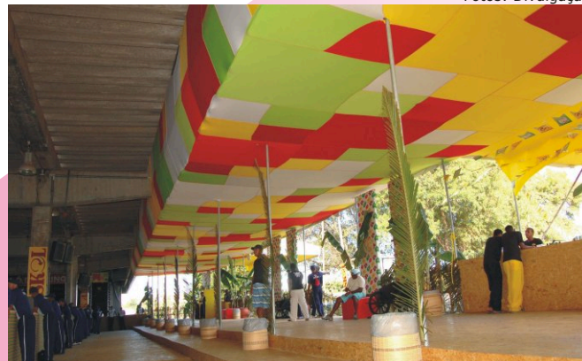
Salvador/BA - Estrutura e ornamentação do Forró do Reino encantam público